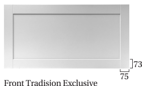
Front Tradisjon Exclusive